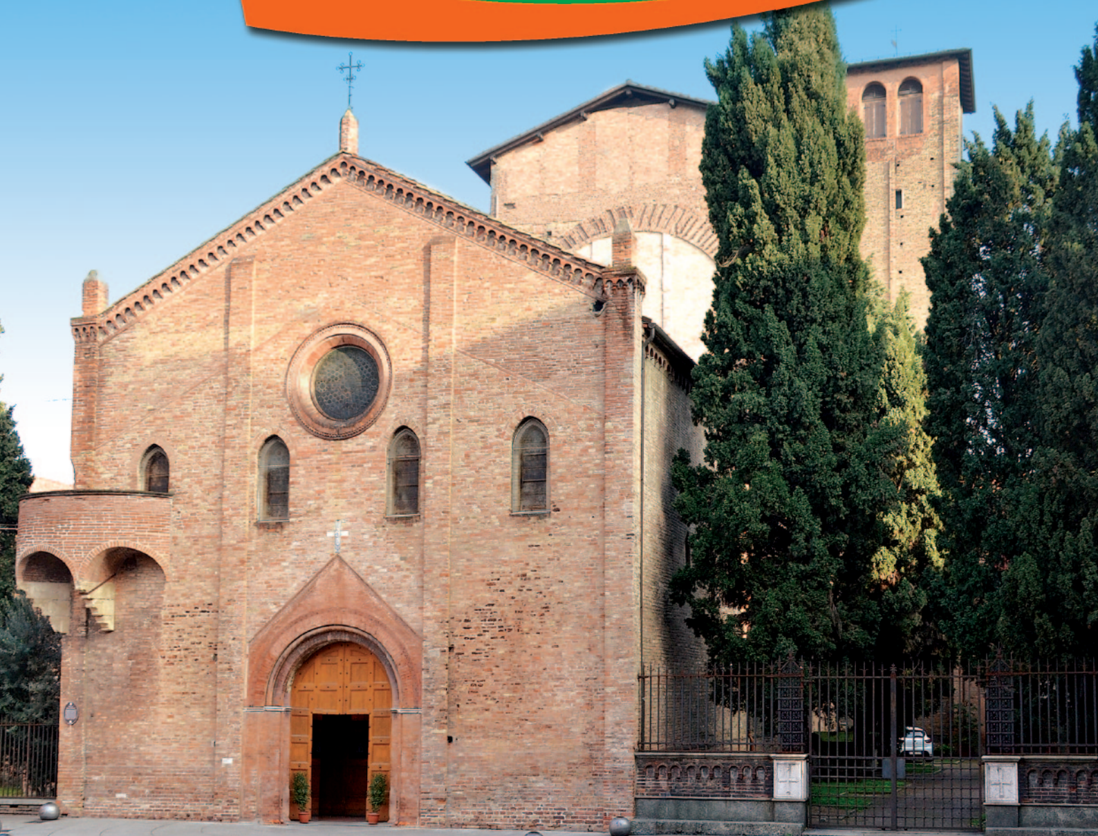
Basilica di Santo Stefano - Bologna